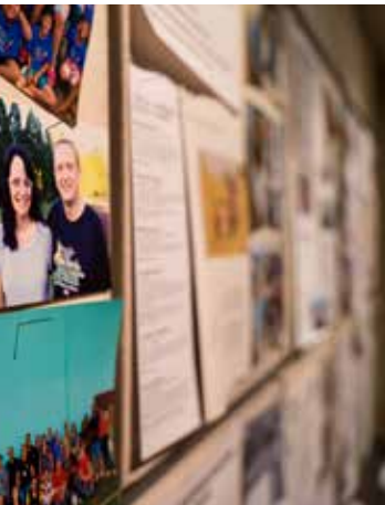
ohn, jonasvonblohn.de en mit der Gemeinde verbundenen projekten in Bildern und Texten