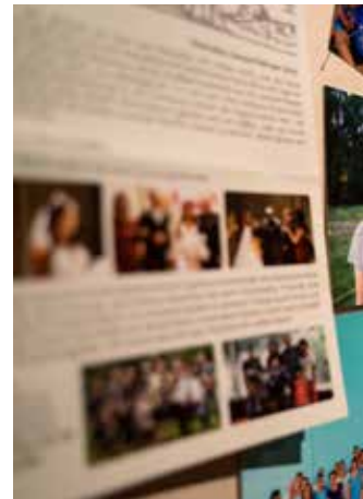
"Missionswand" mit Infos zu den Missionaren mit ihren Hilfsprojekten